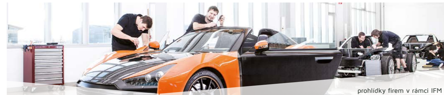
prohlídky firem v rámci IFM