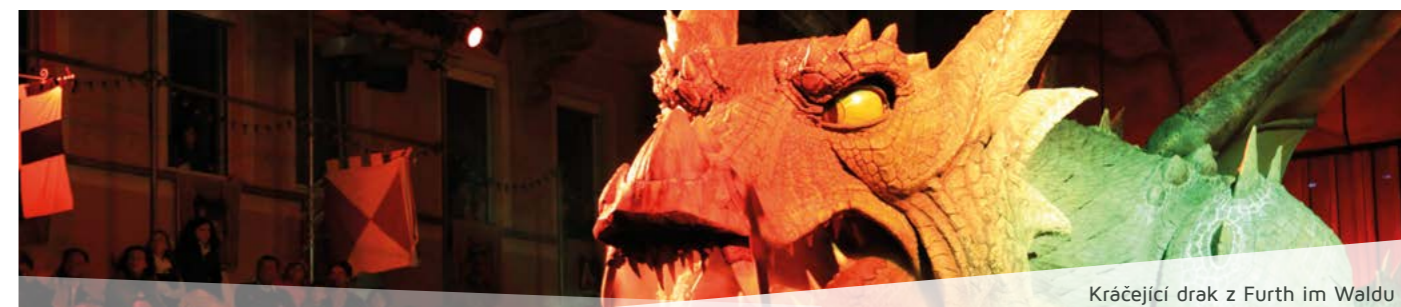
Kráčející drak z Furth im Waldu