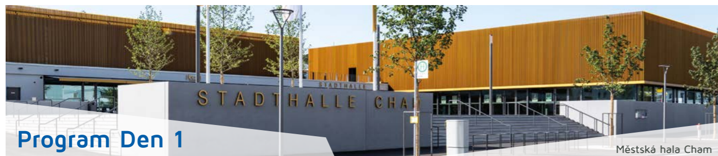
Městská hala Cham